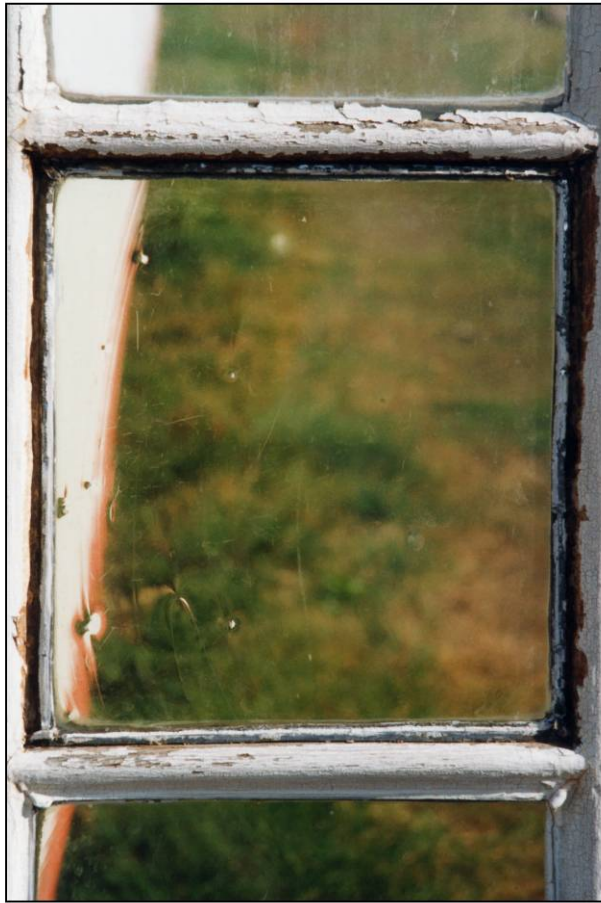
Fig. 4.2. Vitrage (ext.)