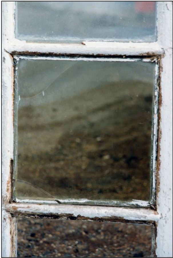
Fig. 4.1. Vitrage (ext.)