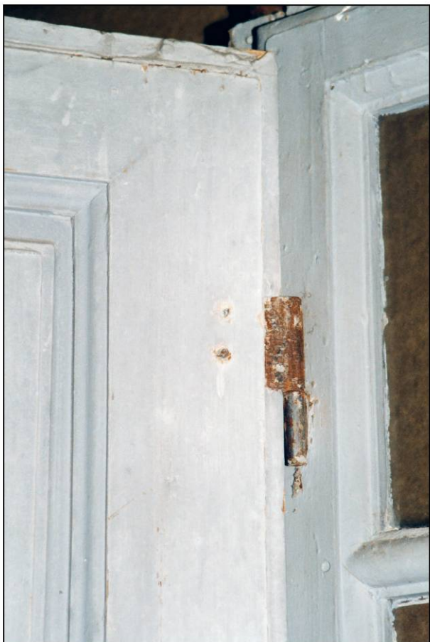
Fig. 4.3. Mouluration et ferrage