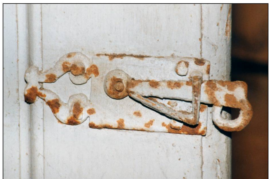
Fig. 4.6. Loquet (autre croisée)