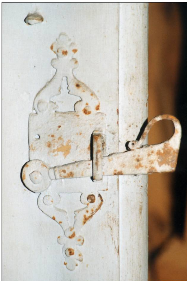
Fig. 4.4. Loquet (autre croisée)