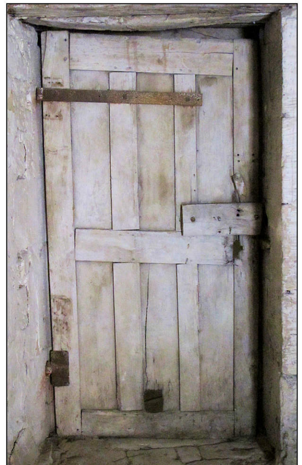
Fig. 2.6. Vantail B (revers)