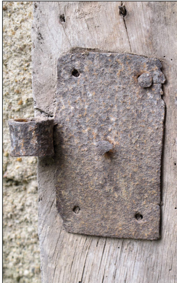
Fig. 2.2. Paumelle