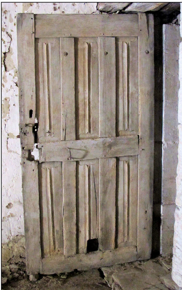
Fig. 2.4. Vantail B