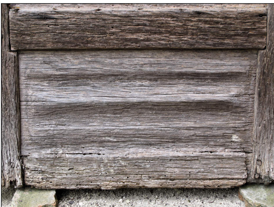
Fig. 2.7. Châssis (soubassement)