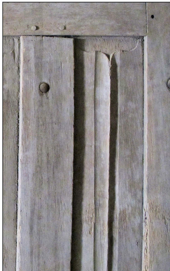
Fig. 2.5. Vantail B (détail)