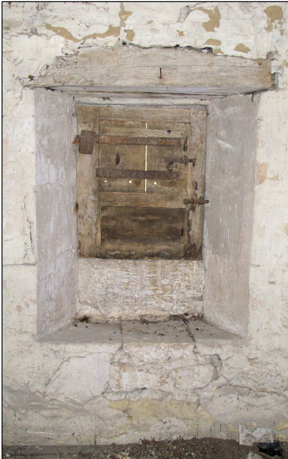
Fig. 2.1. Fenêtre et châssis