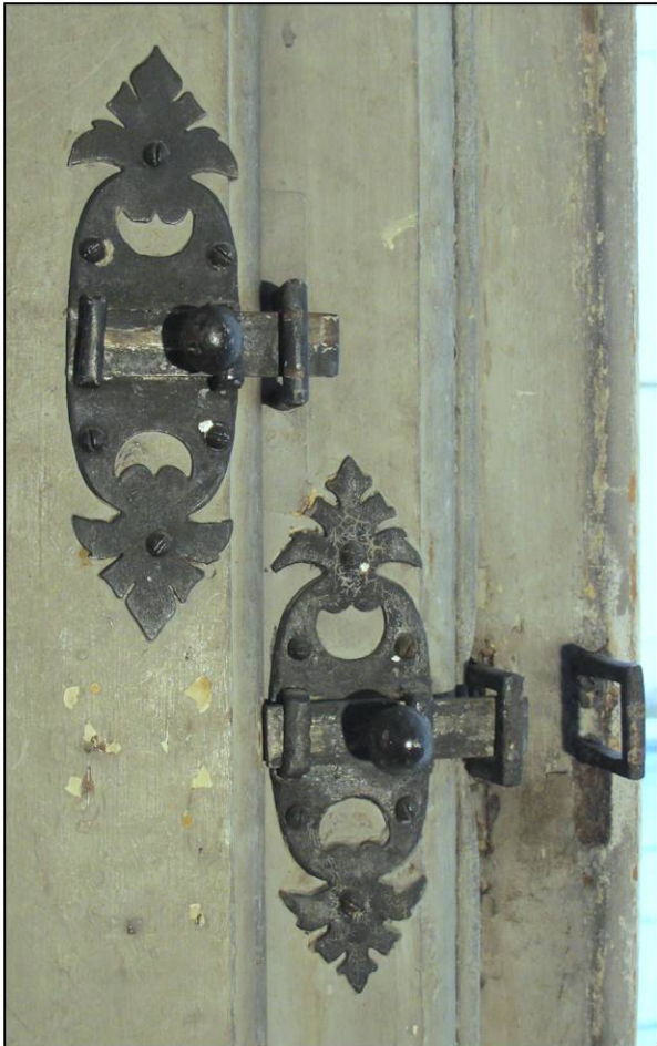
Fig. 13.1. Targettes (emplacement actuel)