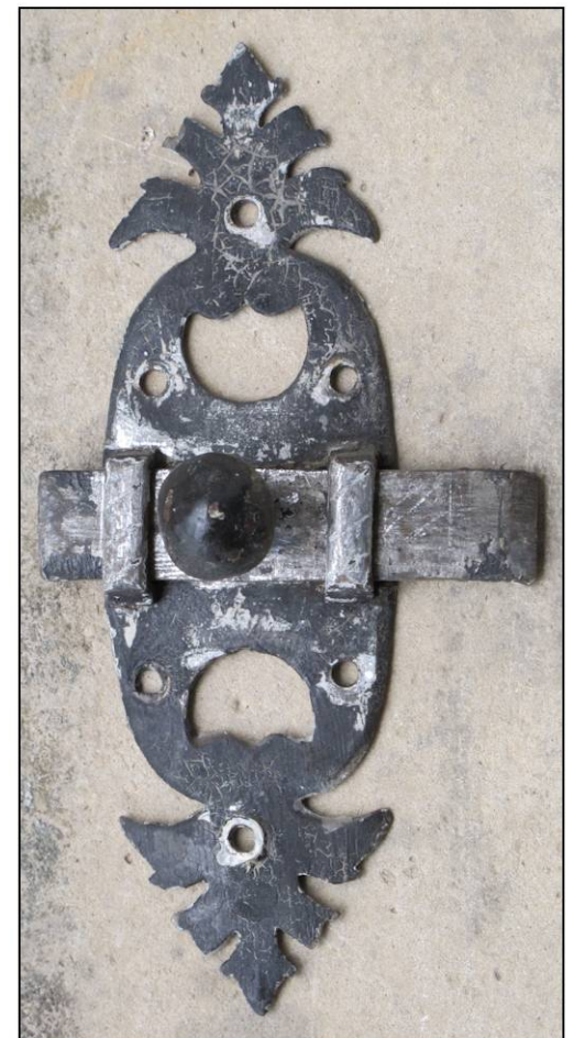
Fig. 13.6. Targette