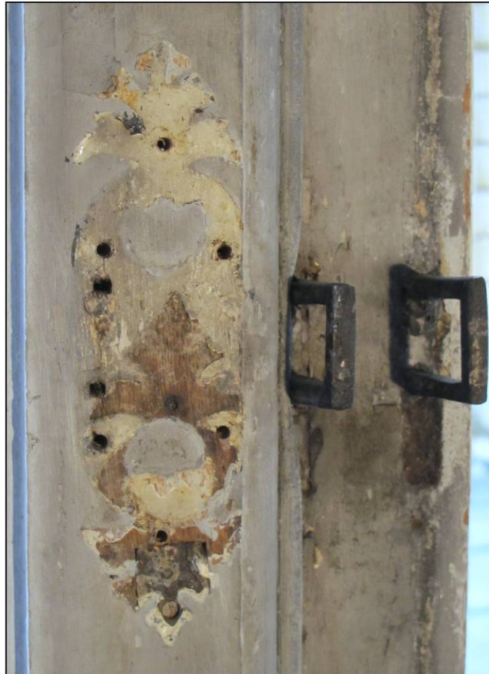
Fig. 13.2. Targette déposée