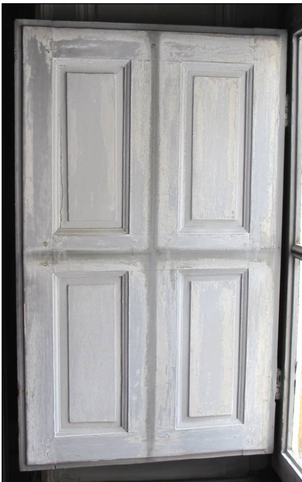
Fig. 13.4. Volet inférieur gauche