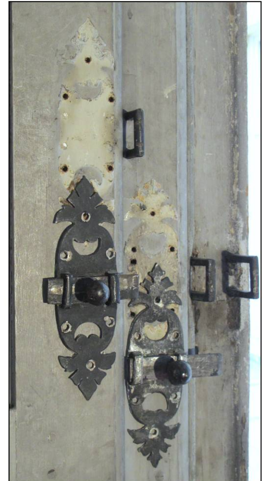
Fig. 13.3. Targettes (emplacement initial)