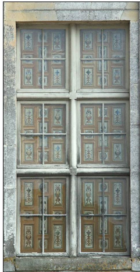
Fig. 11.2. Elévation extérieure