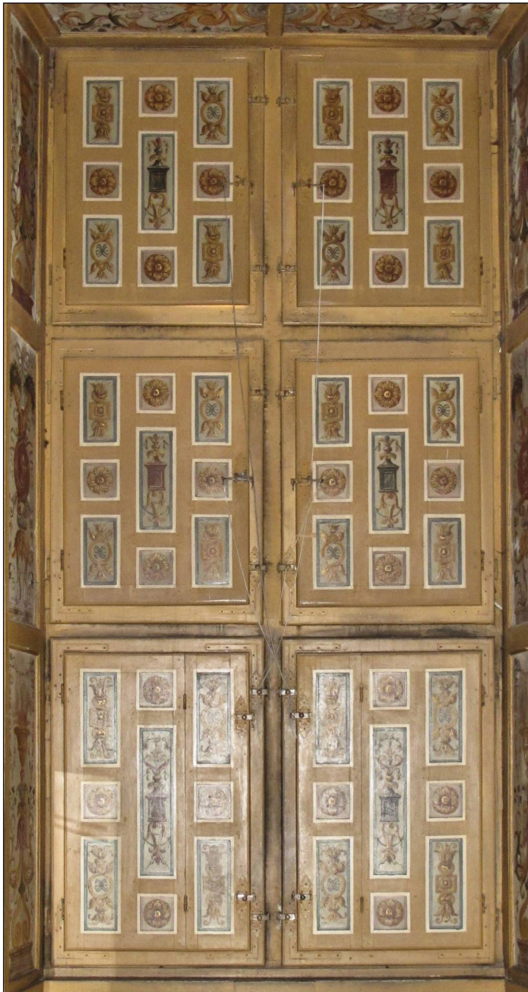
Fig. 11.1. Elévation intérieure