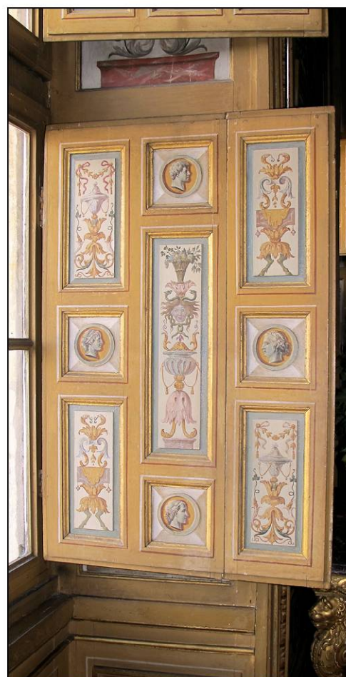
Fig. 11.3. Volet inférieur droit