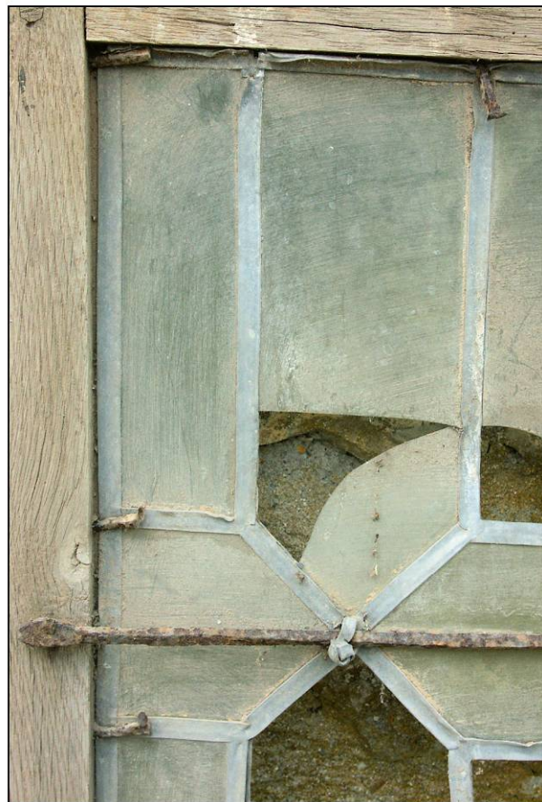
Fig. 4.5. Détail de la mise en plomb