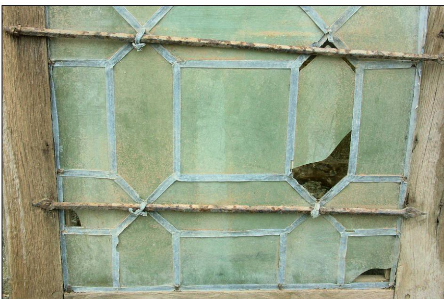
Fig. 4.7. Détail de la mise en plomb