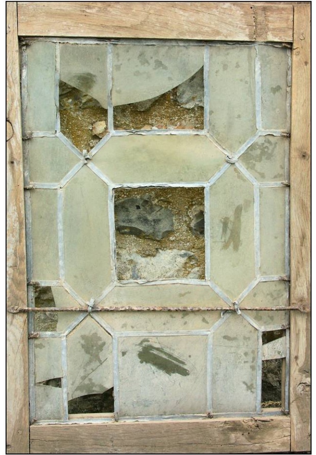
Fig. 4.3. "Pièce carrée" centrée