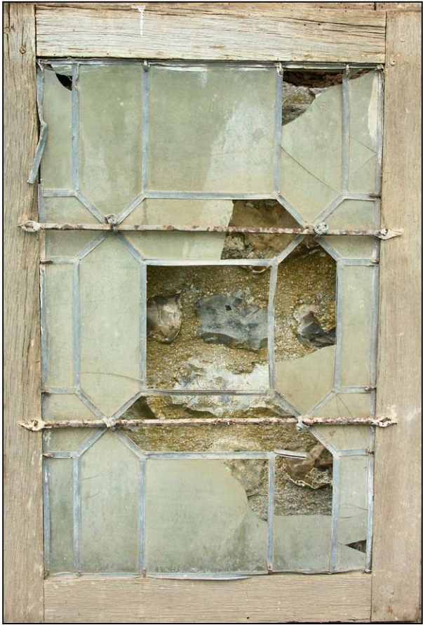
Fig. 4.1. Vitrierie "borne en pièces carrées"