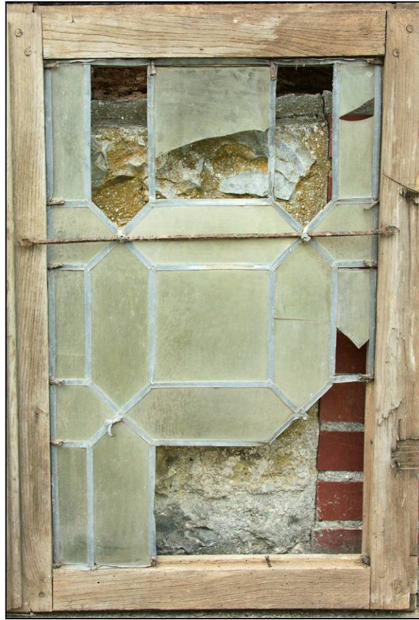
Fig. 4.2. "Pièce carrée" centrée