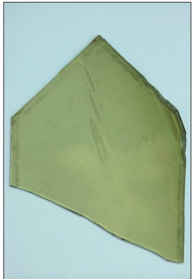
Fig. 4.6. Borne (bourrelet de bord de plateau)