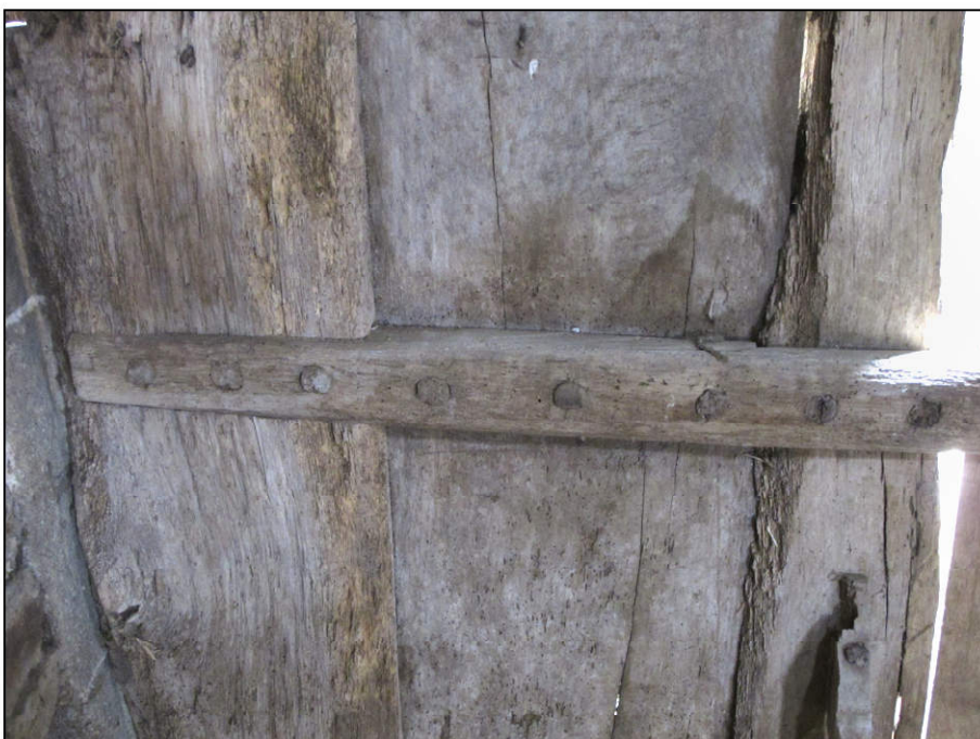
Fig. 6.6. Assemblage d'une traverse