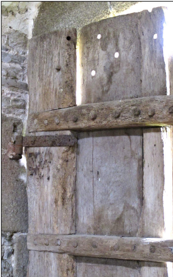
Fig. 6.3. Partie supérieure du vantail