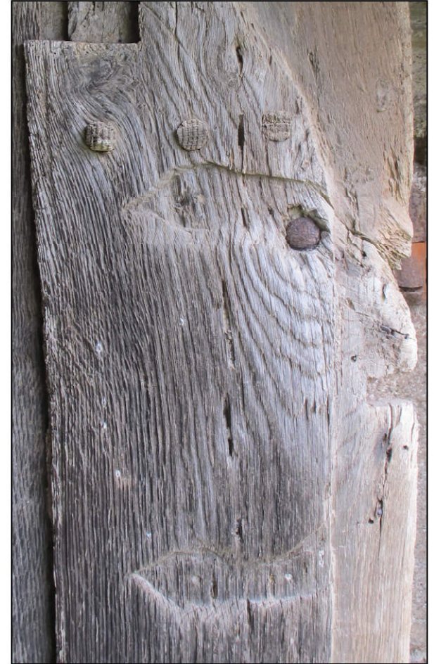
Fig. 6.2. Trace de la peinture du haut