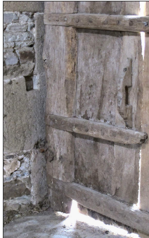
Fig. 6.4. Partie inférieure du vantail