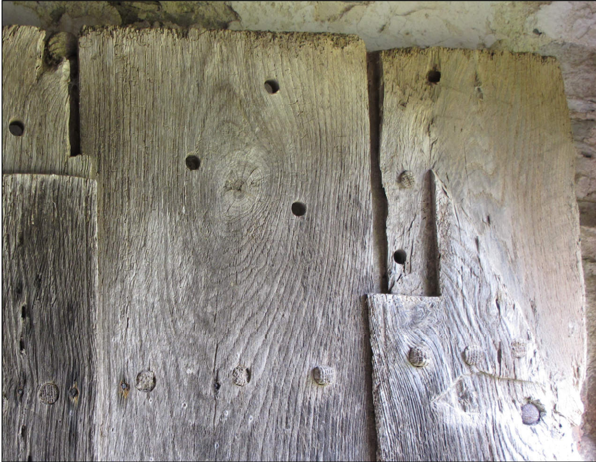
Fig. 6.1. Détail de la partie supérieure