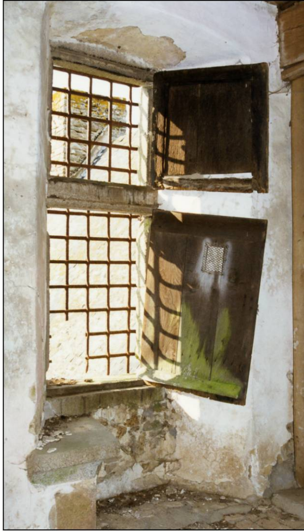
Fig. 3.2. Fenêtre (élévation intérieure)