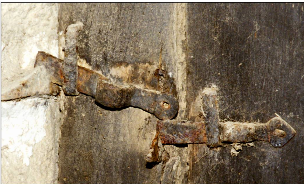
Fig. 3.7. Loquets (vantaill et volet supérieurs)