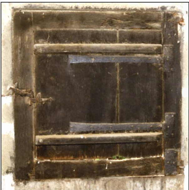
Fig. 3.4. Compartiment sup. (élévation int.)