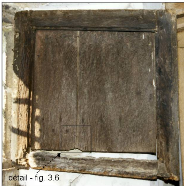
Fig. 3.5. Compartiment sup. (élévation ext.)