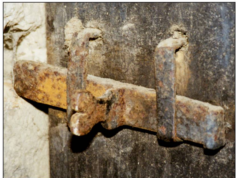
Fig. 3.8. Targette (volet inférieur)