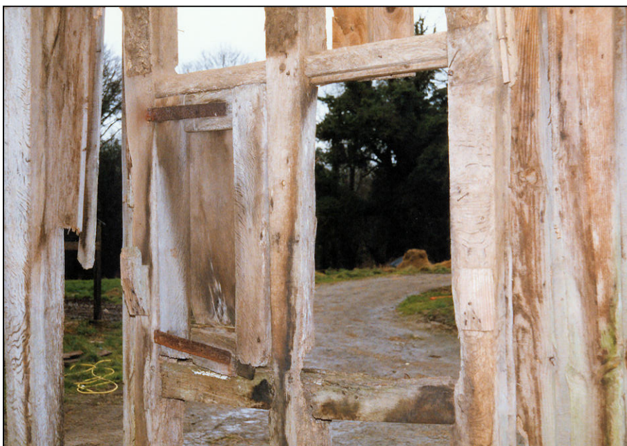
Fig. 2.5. Volet / élévation intérieure