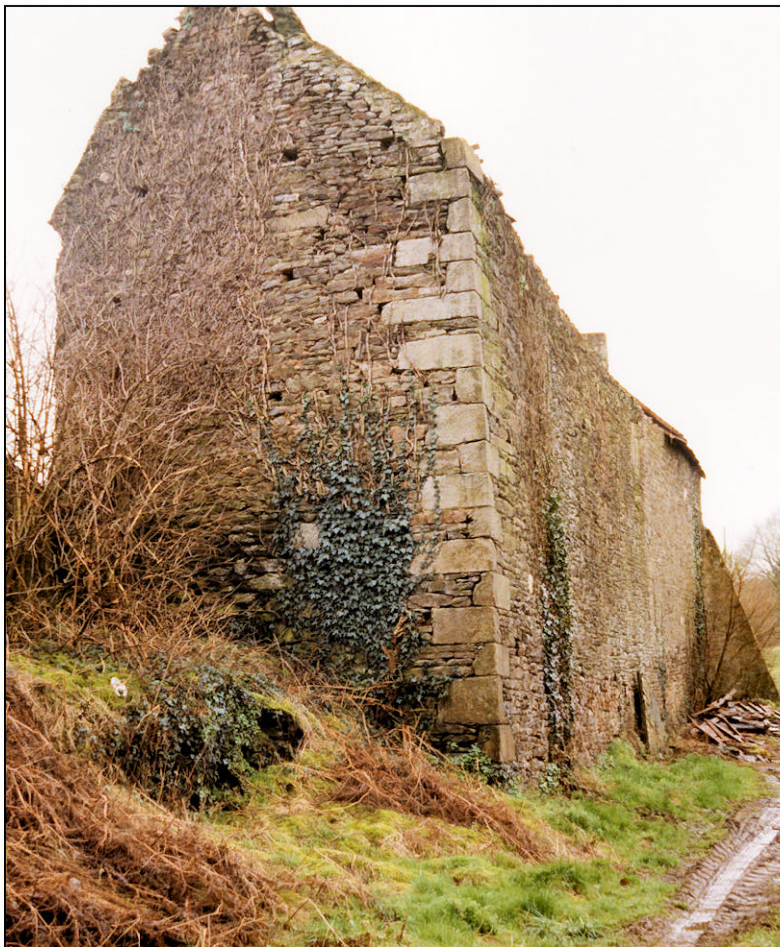
Fig. 1.3. Pignon est et façade nord