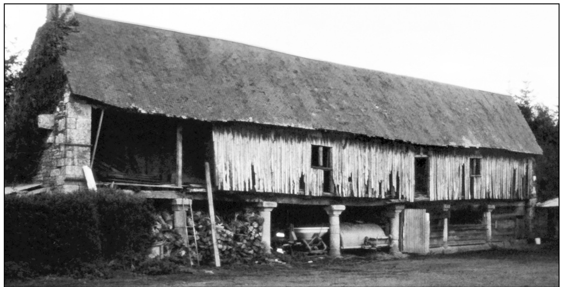
Fig. E.1 - La galerie dans les années 1980.

La galerie est construite en granit et en schiste sur trois faces (fig. 1.3). La quatrième, orientée au sud, est constituée d'un long pan de bois non contreventé (près de 25 mètres) soutenu par des colonnes monolithiques (fig. E.1). Nous n'avons aucune indication sur la fonction de cette galerie accessible depuis ses deux extrémités. Elle n'était toutefois pas dénuée de confort puisqu'une cheminée, adossée au pignon ouest, permettait de la chauffer en partie (fig. 1.5). Son pan de bois est encore dissimulé derrière un bardage de planches. A l'origine, il était garni de torchis sur fusées et composé de sept travées. Deux subsistent encore, en équilibre précaire (fig. 1.1 et 1.3).