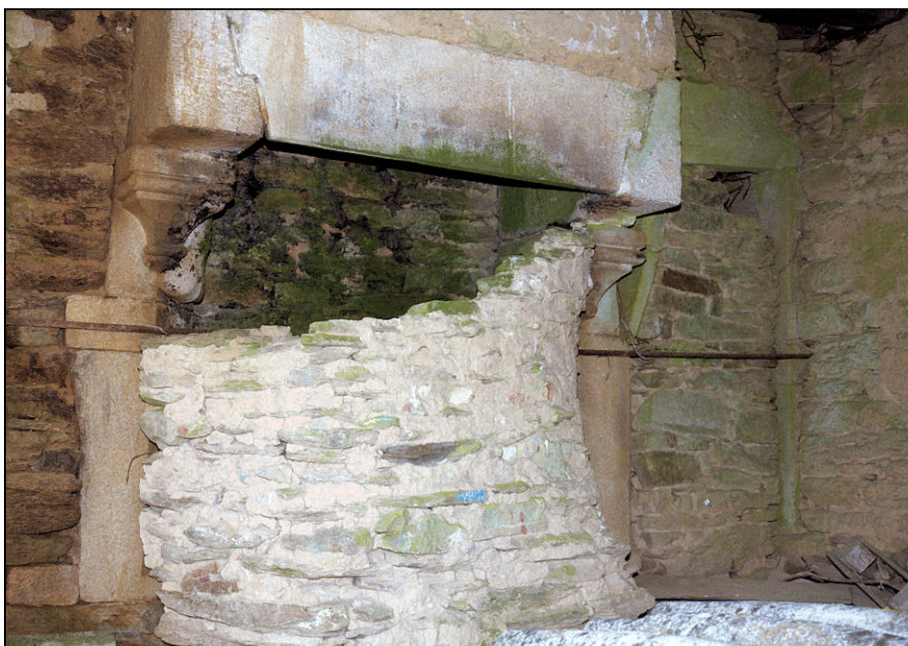
Fig. 1.5. Cheminée (pignon ouest)