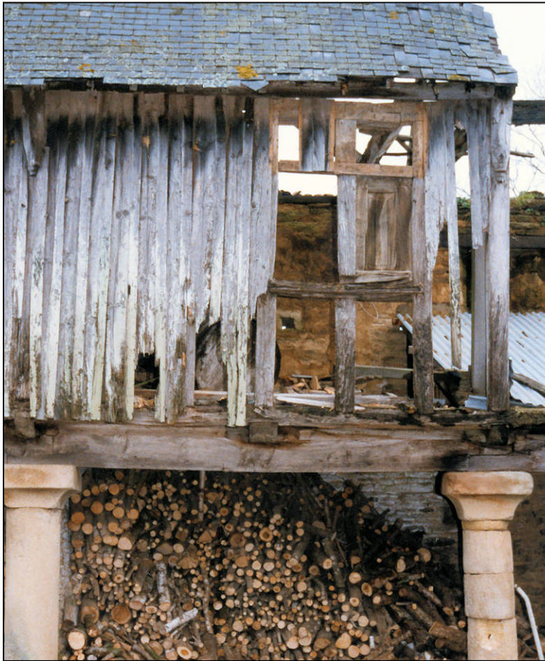
Fig. 1.1. Pan de bois (3 e travée)