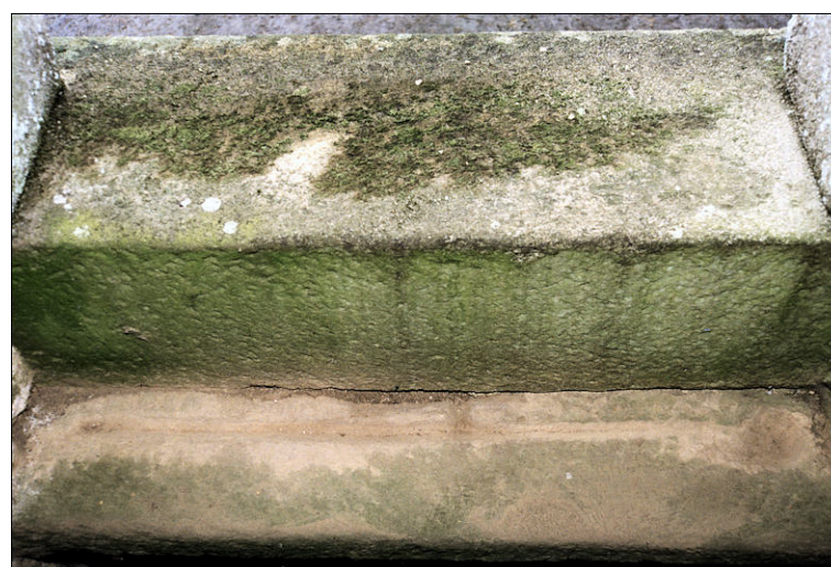
Fig. E.2 et E.3 - La lucarne du logis et son appui en pierre A noter le canal de récupération des eaux pluviales et son évacuation au centre, ainsi que l'alvéole, à droite, pour maintenir le pivot du volet (dispositions identiques au manoir de Kermeno à Moréac – étude n°56005)