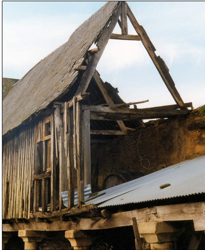
Fig. 1.2. Pan de bois et charpente