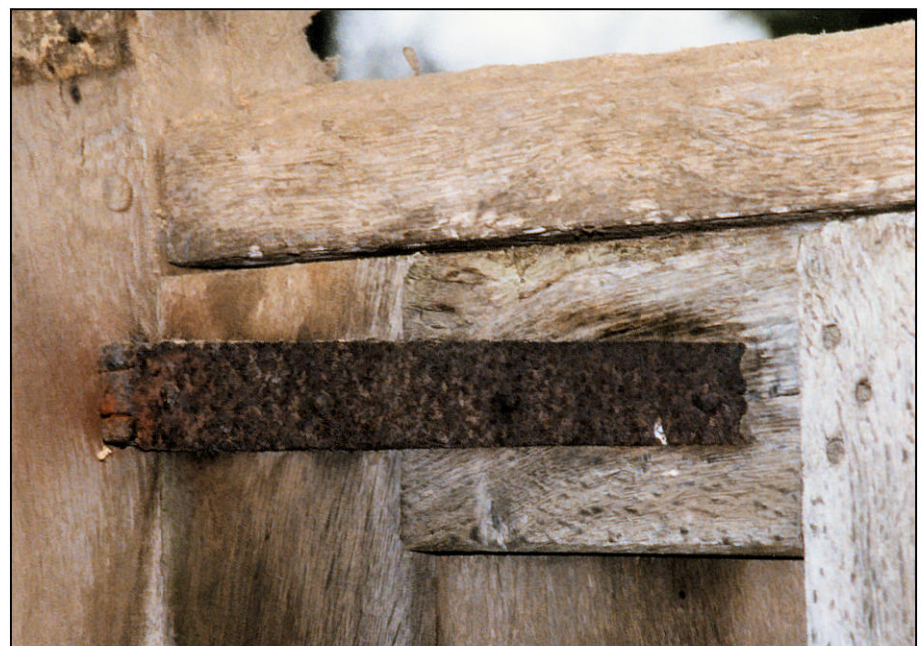
Fig. 2.6. Volet / charnière