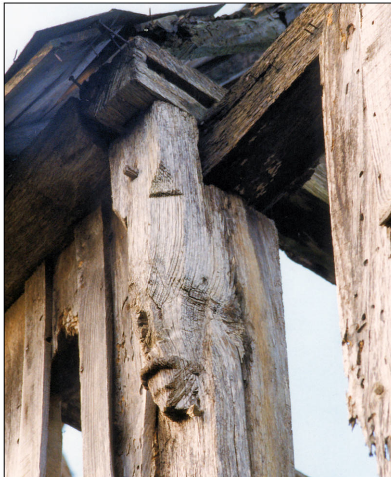
Fig. 1.4. Assemblage (poteau / sablière / entrain)