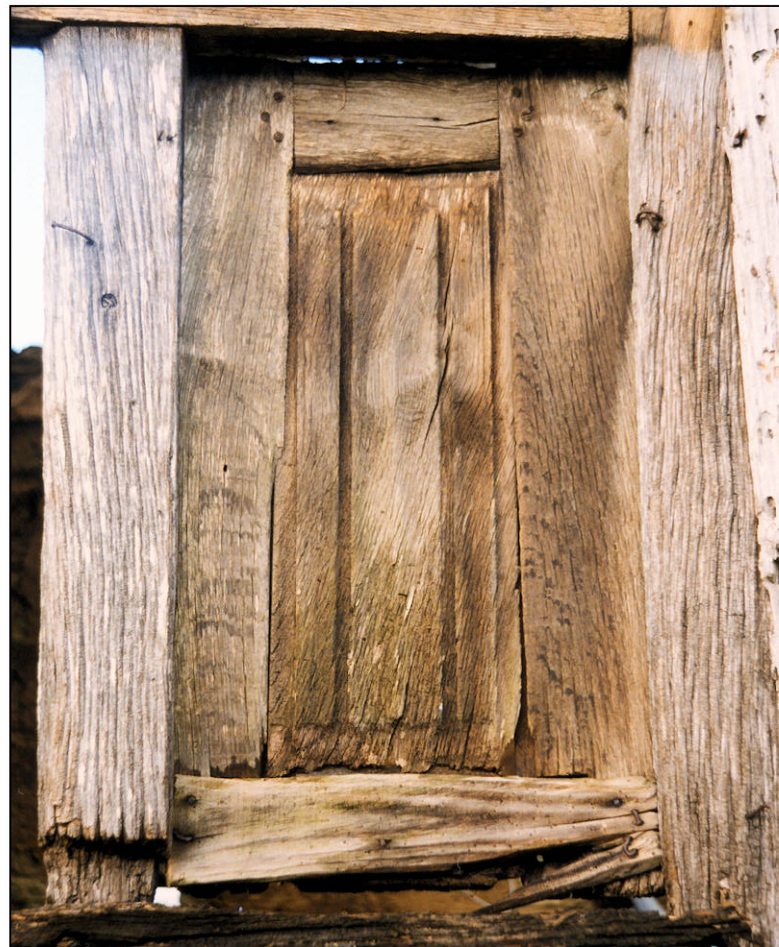
Fig. 2.4. Volet / élévation extérieure