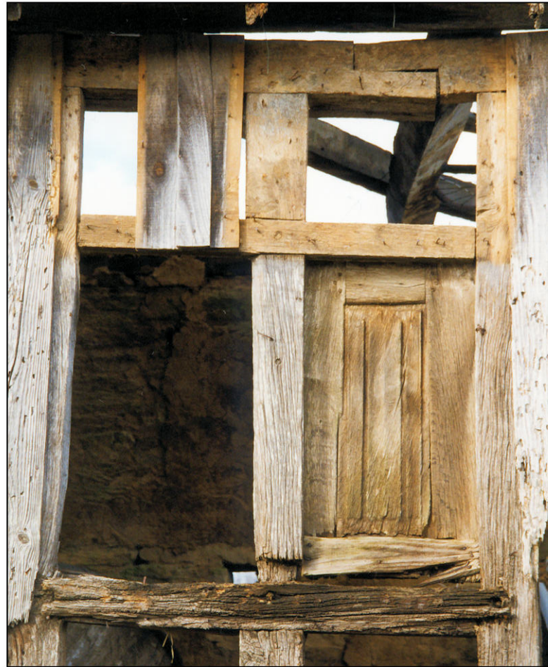
Fig. 2.2. Fenêtre / élévation extérieure