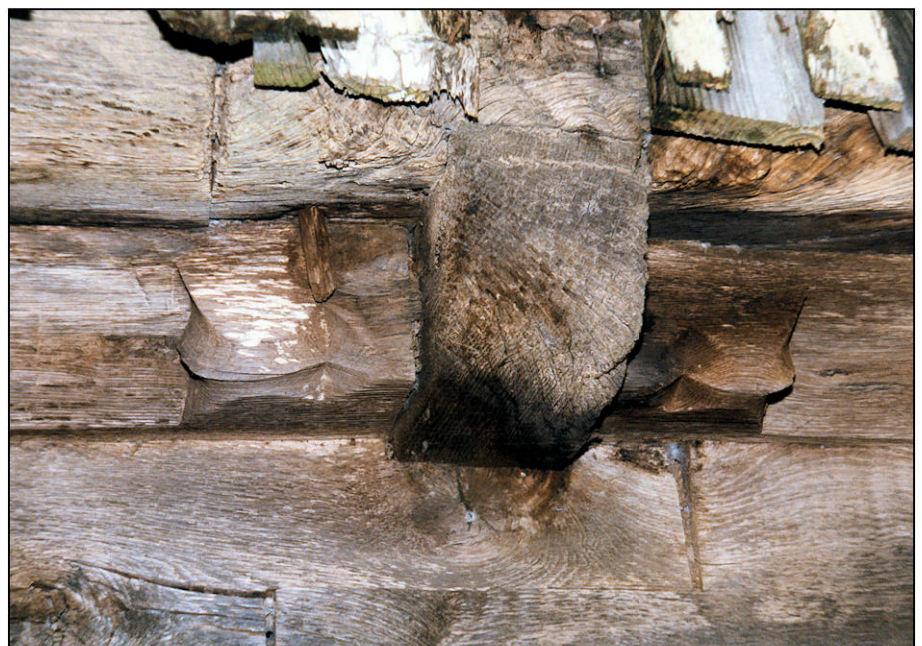
Fig. 1.6. Assemblage (poutre / solives / sablières)