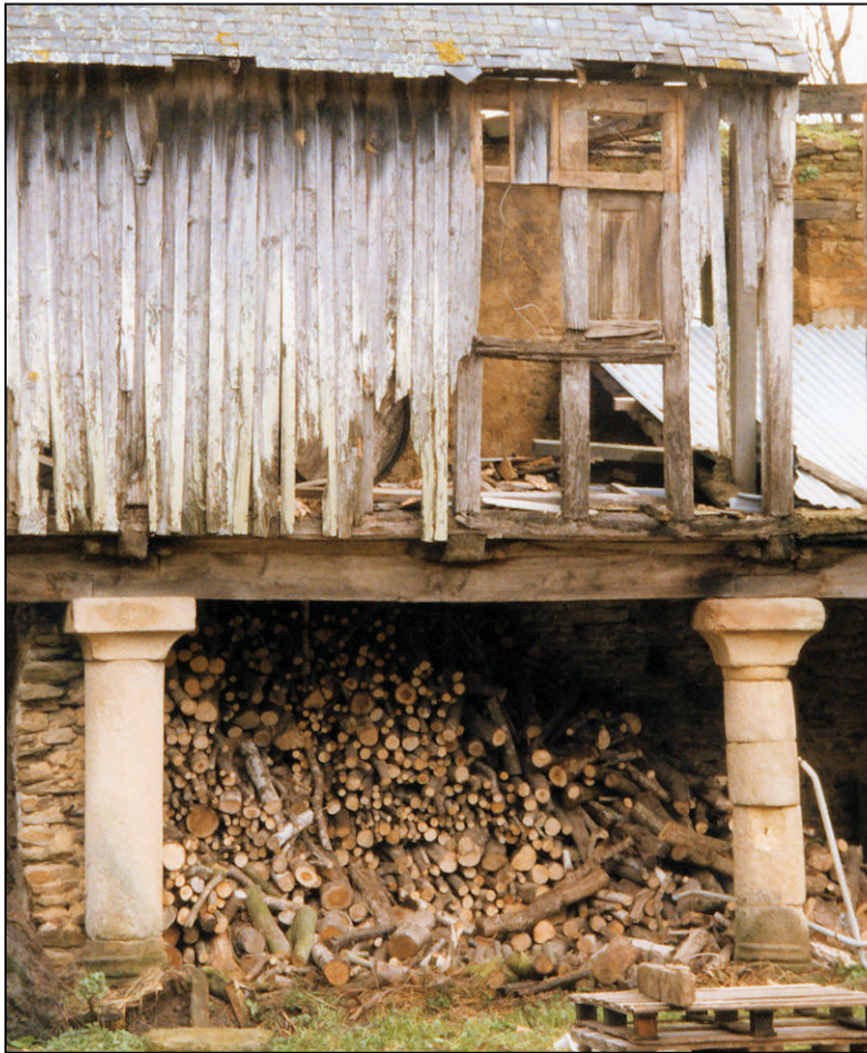
Fig. 2.1. Pan de bois (3° travée)