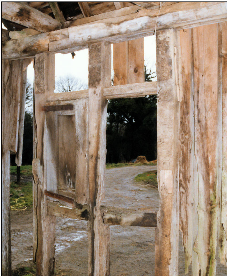
Fig. 2.3. Fenêtre / élévation intérieure